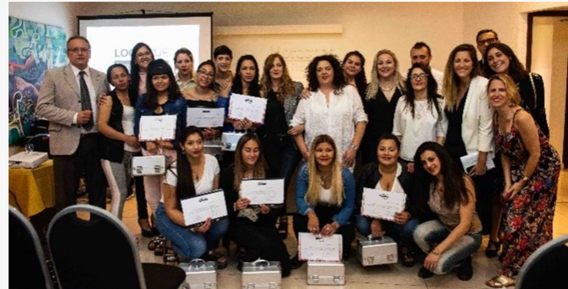
Graduación Look que transforma Mendoza 2019