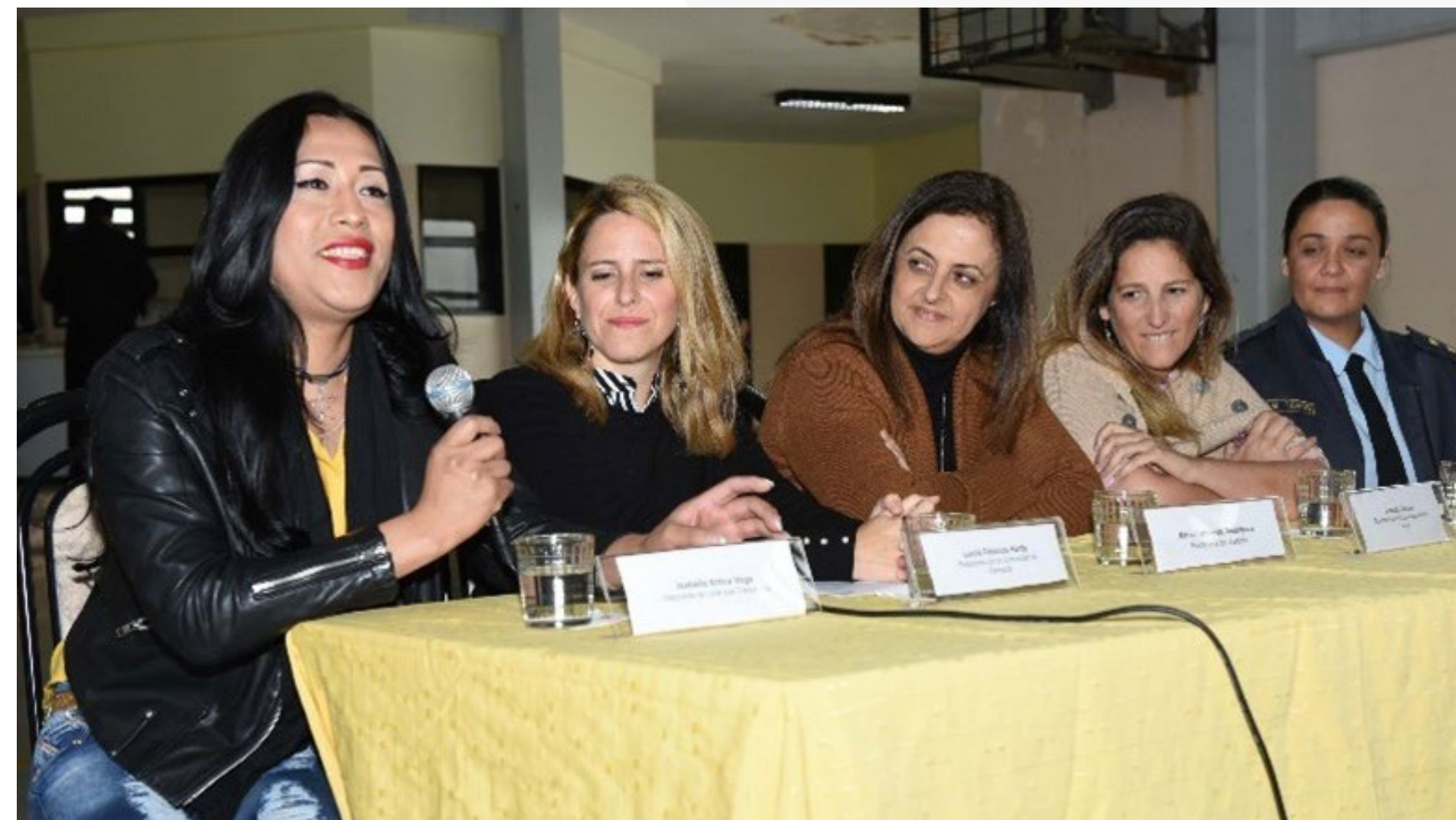
Acto de graduación LQT Unidad 31, Ezeiza 2019