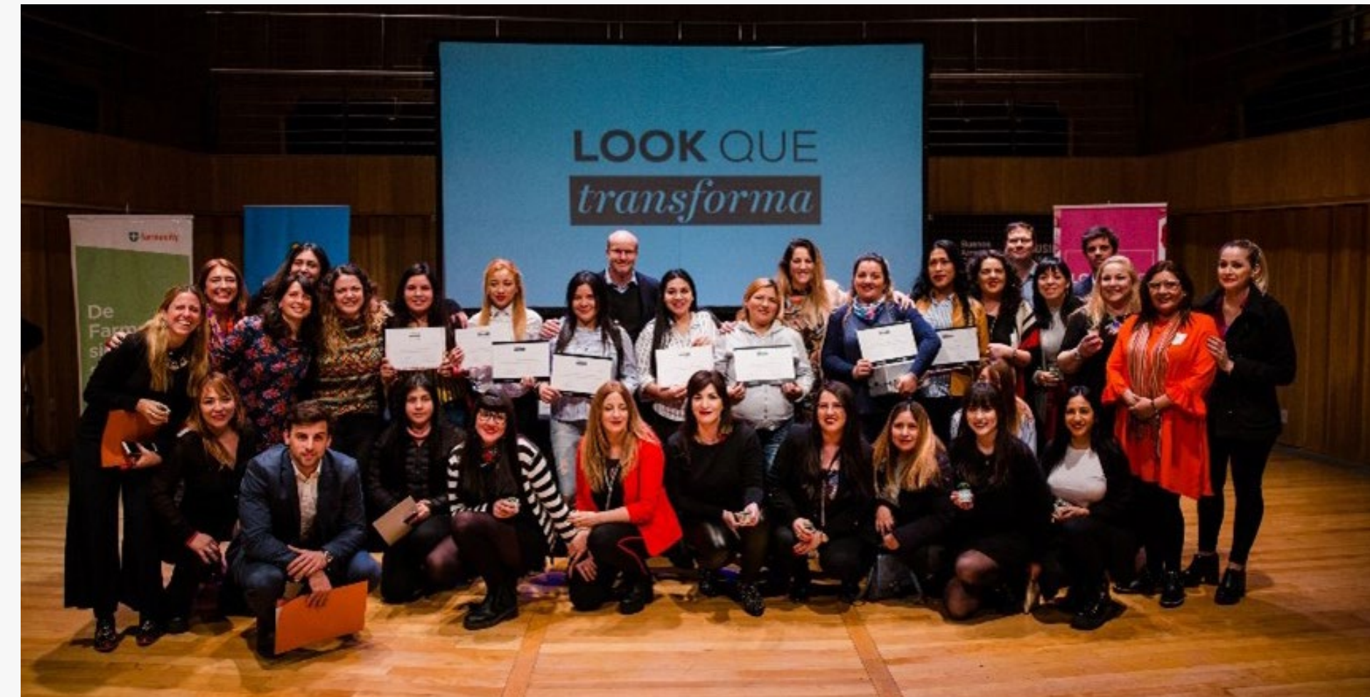
Egresadas Look que transforma edición CABA 2019